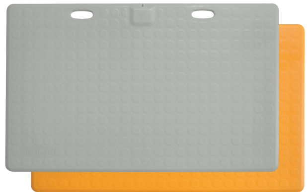
CareMat® TRX A, Bettvorlage, 110 x 70 cm, 8,2 kg