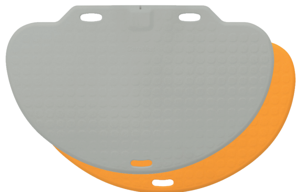
CareMat® TRX C, Bettvorlage, halbrund, 110 x 70 cm, 6,5 kg